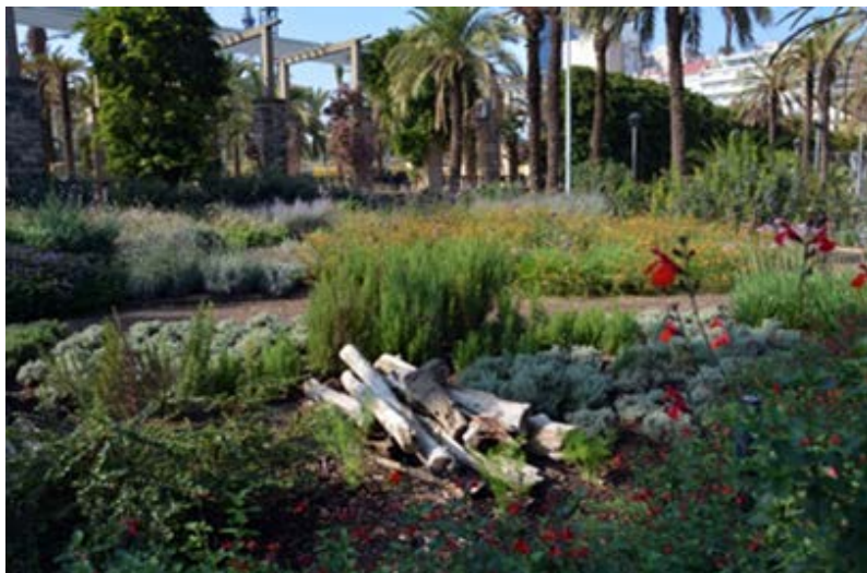
Creación espacio interés para la biodiversidad Parc Joan Miró. Distrito de l'Eixample