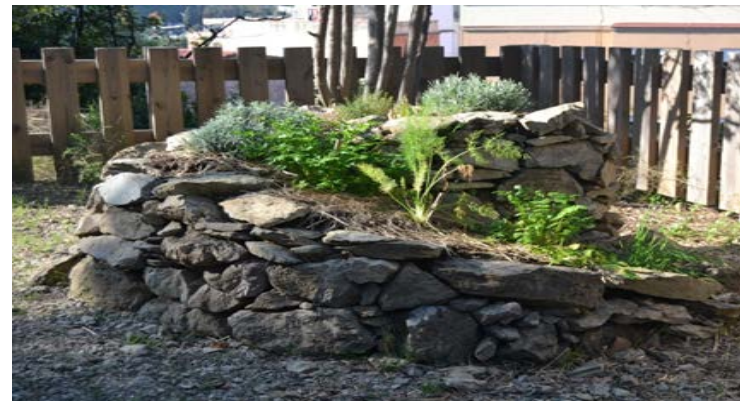
Piramide de madera en Mas Ravetllat y espiral de insectos