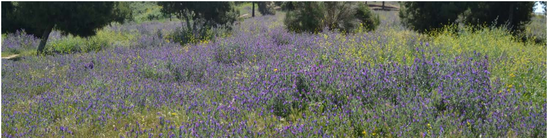
Refugio de fauna. Parc del Migdia, Montjuïc

Barcelona quiere naturalizar sus espacios verdes y realizar una gestión más ecológica para: