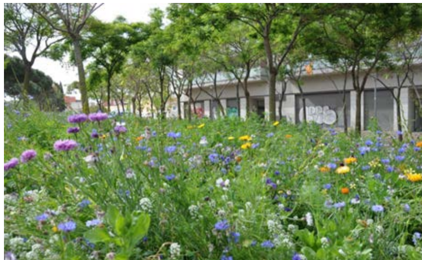
Siembra de pradera de flores atraientes a la fauna util en parterre C/ Ferrocarrils Catalans. Distrito de Sants- Montjuïc