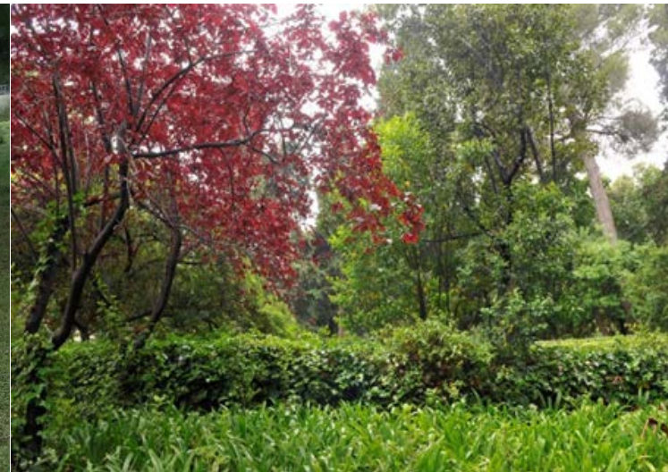
Estratificación de la vegetación, parque del Laberinto de Horta

Naturalizar los espacios verdes de la ciudad es intervenir para enriquecer la biodiversidad.